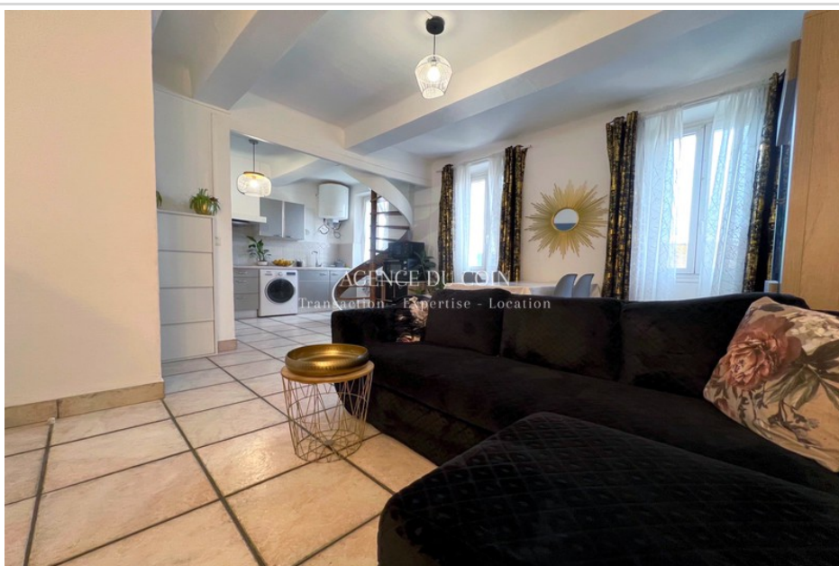
Apartment Le Muy